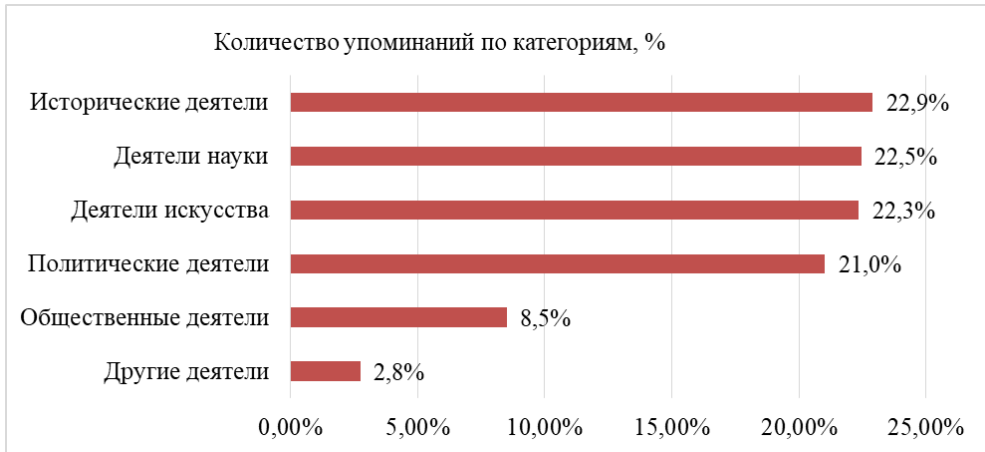
Диаграмма 1 – Количество упоминаний людей, ассоциативно связанных с Европой, по категориям

Таким образом, Европа в представлении студентов ассоциируется прежде всего с людьми, олицетворяющими события истории, авторами научных открытий и произведений искусства.