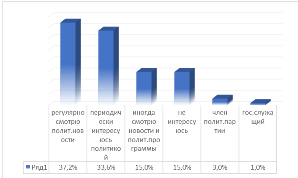
Рисунок 1 – Какое место в вашей жизни занимает политика?

Одна из тенденций, которая была выявлена в ходе анализа результатов анкетного опроса – одинаковое количество респондентов (по 15%) при выборе ответа на данный вопрос отметили, что они крайне редко интересуются и смотрят политические программы и новости, либо вообще не проявляют интереса к политике (рис. 1). Таким образом, можно говорить о том, что у студенческой молодежи социально-гуманитарных направлений подготовки преобладает высокий интерес к политической сфере, а также к тем событиям, явлениям и процессам, которые в ней происходят. В то же время, примерно для трети опрошенных респондентов политика не занимает важное место в их жизни, и они не проявляют интереса к политическим новостям, событиям, процессам и явлениям.