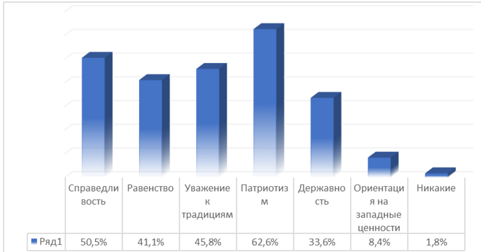
Рисунок 3 – Выберите ценности, которые, на ваш взгляд, являются ключевыми для российского государства

По мнению респондентов, ключевыми для российского государства являются: «державность» – 33,6% и патриотизм 62,6%. Можно предположить, что выбор респондентов данной ценности в качестве ключевой для российского государства свидетельствует о консервативной направленности их восприятия российских политических ценностей. Другими популярными вариантами стали «справедливость» (50,5%), а также «патриотизм» (45,8%). Самым непопулярным стал вариант «ориентация на западные ценности» (8,4%). Данный факт свидетельствует о том, что в восприятии респондентов существует разграничение между российскими ценностями и западными. И при этом западные ценности не характерны для современного российского государства и его политической системы (Рис. 3), с точки зрения студентов КубГУ, которые приняли участие в опросе.